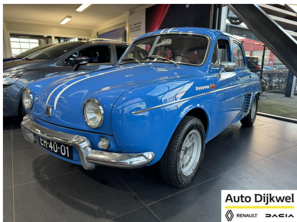
Auto Dijkwel RENAULT DACIA