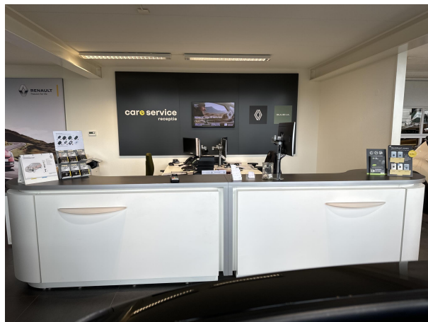
CARTEAM AUTO DIJKWEL