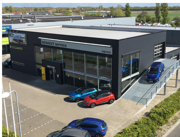
Auto Dijkwel RENAULT DACIA